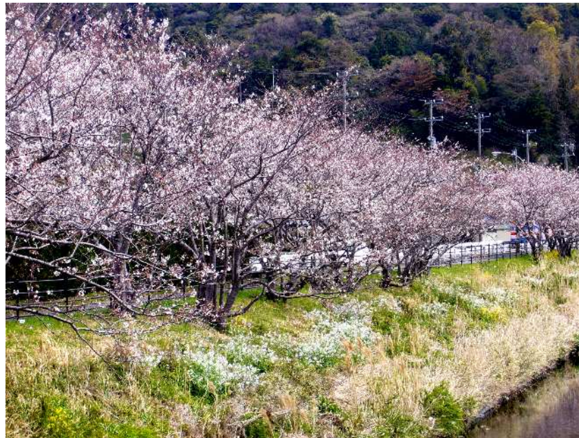
(榛原中学校近くの勝間田川にて)

今回の事務所通信は、年度替わりということもあり、登記に関する税制改正と事務所からのおめでたい話題等をお伝えします。