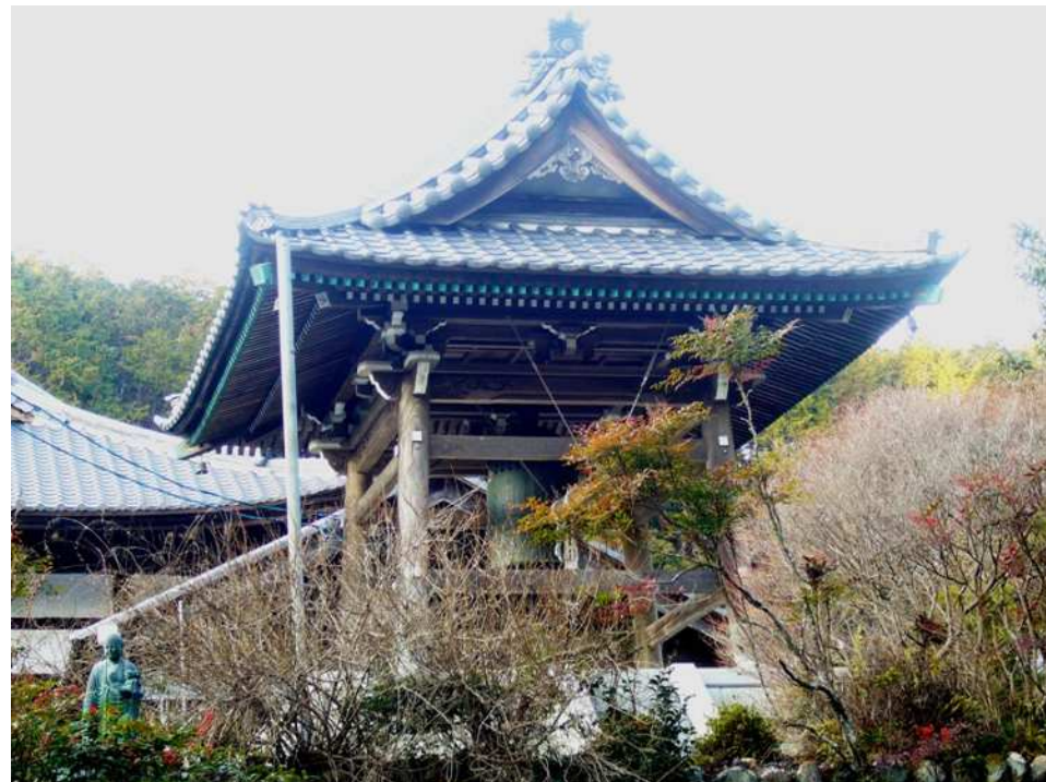
写真は、高尾山石雲院

今回は年始めでもありますので、色々な情報提供をさせていただき、新春の事務所通信とします。